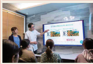
上_相談会では、適応、手術までの流れ、治療に対する不安や疑問を丁寧に説明 右_点眼麻酔し手術を行う。ほとんど痛みなく、翌日視力が回復するiLASIK

中国医科大学卒業、同大学大学院修了。アメリカ留学後、日本の医師免許を取得。2012年愛媛大学眼科准教授に就任したのち開業