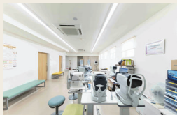
白内障、屈折矯正、眼形成の三本柱を軸とし、診察にあたるはなみずき眼科

はなみずき眼科では、新たに2つの機器を導入。「3Dヘッドアップサージェリー」は、55インチの大画面モニターで立体画像を見ながら手術ができるシステム。通常の顕微鏡では確認しづらかった組織を高精細な4Kデジタル映像で確認でき、より安全で正確な手術を可能に。画像自体を明るくして見られるので、患者が感じるまぶしさ、光による網膜障害も大幅な低減も期待できる。また、リラックスして手術を受けられるように、「低濃度笑気麻酔」を導入。痛みによる不快感が軽減され、手術後も麻酔が体に残らず副作用の心配が少ないので安心だ。