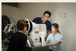
情報のアンテナは常に伸ばし、機器や治療法の知識もアップデート